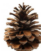
la pomme de pin