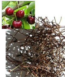
les queues de cerises